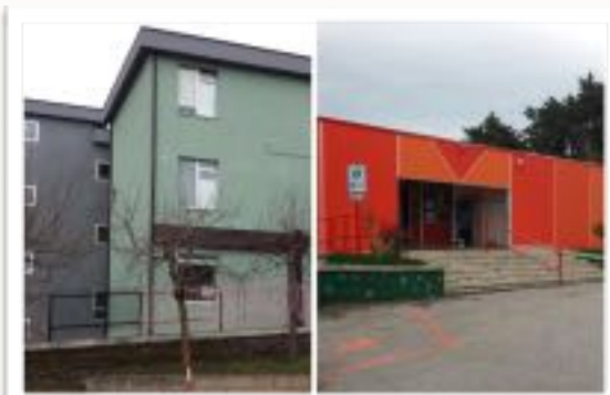
Atrio Scuola Primaria Tempo Pieno, Via P. Corona